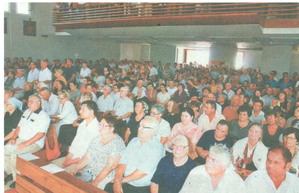
Nadbiskup je u propovijedi istaknuo sve majčine vrednote

Ovo je blagdan pjesme majci, našoj svetinji. Majka nam pruža temeljni osjećaj sigurnosti i prihvaćenosti. U velikoj krizi dostojanstva majke, muževi u ženama nadasve poštuju materinsko dostojanstvo, poručio je u Škabrnji nadbiskup Puljić