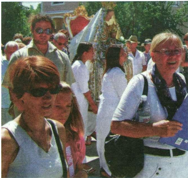
Procesija s Gospinim kipom

Ždrelašćici. Brojni hodočasnici i mještani Kukljice pohrlili su Gospi Snježnoj koja stoljećima svojim svetim zagovorom čuva ovo mjesto i njegove žitelje. Postoji tra-