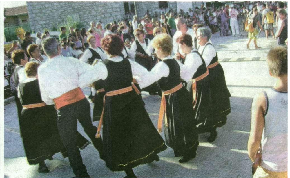
Tijekom programa KUD Kukljica otplesao je "kolo po našu"