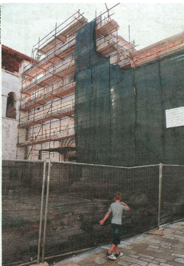
Radovi na pročelju su gotovi, osim onih na glavnom i bočnom portalu

zoni ima plitku galeriju i monumentalni portal te još dekorativnih dijelova, pa smo ga pažljivo očistili i restaurirali dijelove koje je trebalo restaurirati.