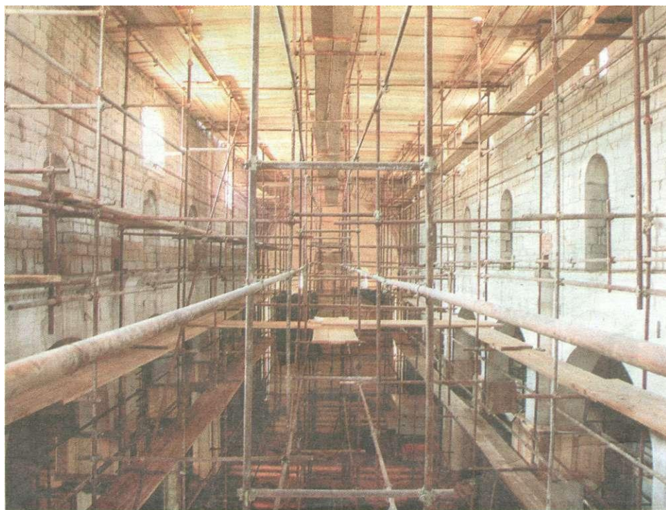
Gusta šuma skela omogućuje sigurne radove u crkvi

Radove na krovu crkve sv. Krševana vršio je prije više od 100 godina Ćiril Metod Iveković, no oni tada nisu dovršeni jer nije riješen problem vlage koji on je prije tri godine došao "na naplatu". S radovima se u ovom stoljeću započelo 2008. godine u travnju kada je krov počeo ozbiljno prokišnavati. Kupa se pomakla, a postojala je i opasnost da za jake nevere ili vjetrovi komadi padnu na ulicu i nekoga ozlijede