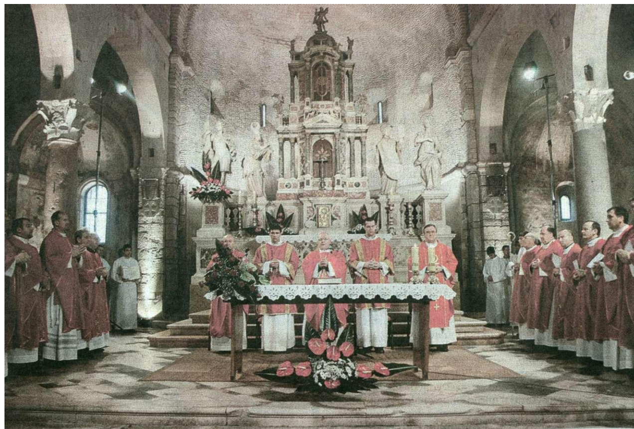
Mise su se u crkvi održavale na dan sv. Krševana 24. studenog koji je ujedno i Dan grada, te na Staru godinu