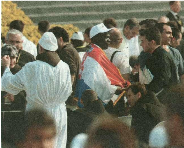
Na susretu s Papom došli su i stranci

- Drage obitelji, ne bojte se! Gospodin ljubi obitelj i blizu vam je, poručio je Sveti