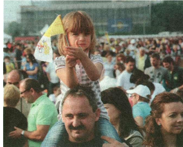
S tatinih leđa re se bolje vidi

Među njima, zatekli smo braću Jakova i Filipa Man-