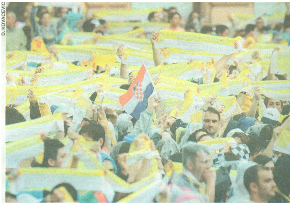
Otvorenost, simpatije i ljubav koju su ljudi pokazali prema papi neće ostati bez ploda