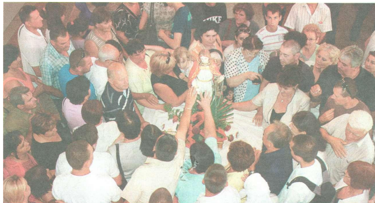
Mnoštvo vjernika oko kipa Sv. Nediljice

U propovijedi je biskup Bogović podsjetio na život Sv. Nediljice ili Svete Domenike, rimske mučenice, lijepe do-