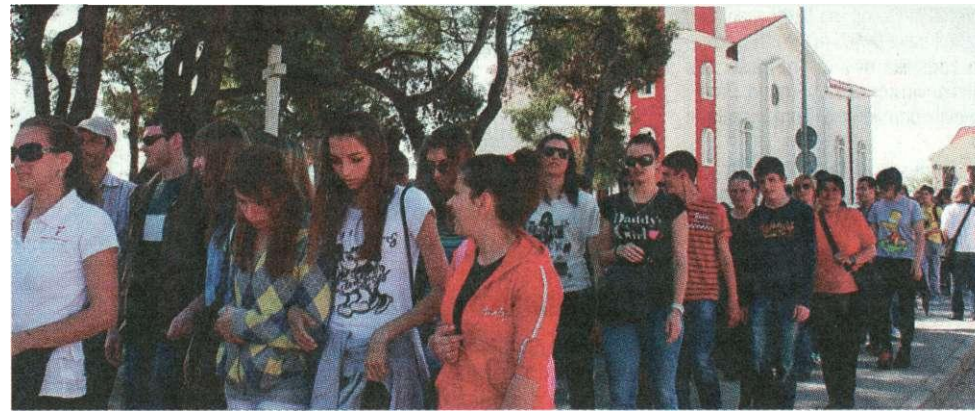
Križni put mladih krenuo je ispred zemuničke župne crkve

Uz snažne meditacije i molitve koje potiču na dubinsko preispitivanje nakon prve postaje Križnog puta u župnoj crkvi križ su prvi ponijeli