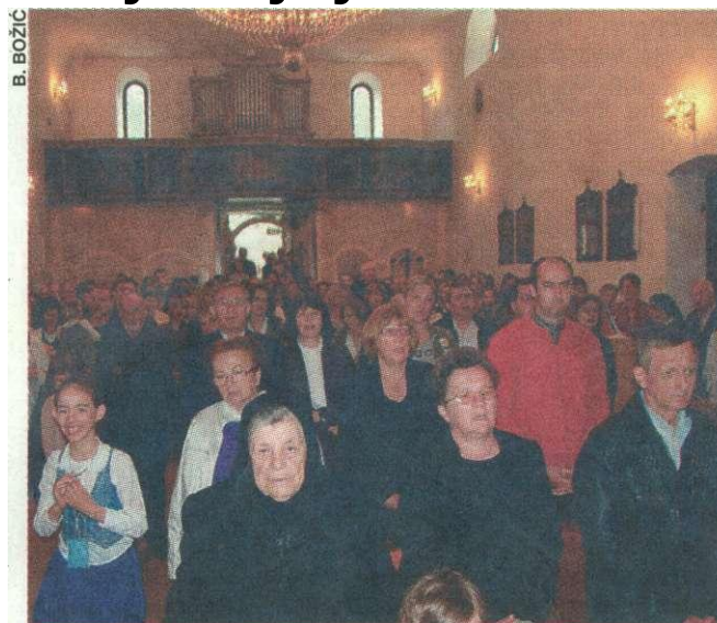
Uskrsna misa u ninskoj crkvi sv. Anselma