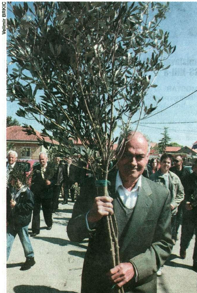
Opstao je sukošanski običaj blagoslova velikih grana maslina

Blagdansko slavlje svojim su napjevima "Kad je ono Go- spodin ulazio u sveti grad", "Bože moj, Bože moj zašto si me ostavio", "Krist postade po- slušan do smrti na križu" i os- talima uveličali ninski pučki cr-