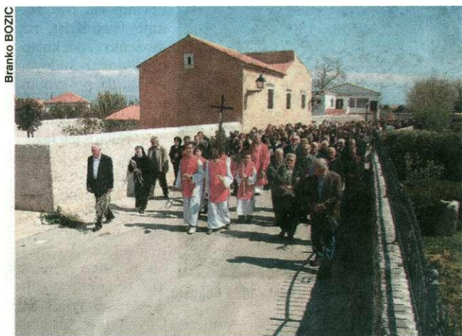
Procesija Ninom s maslinovim grančicama