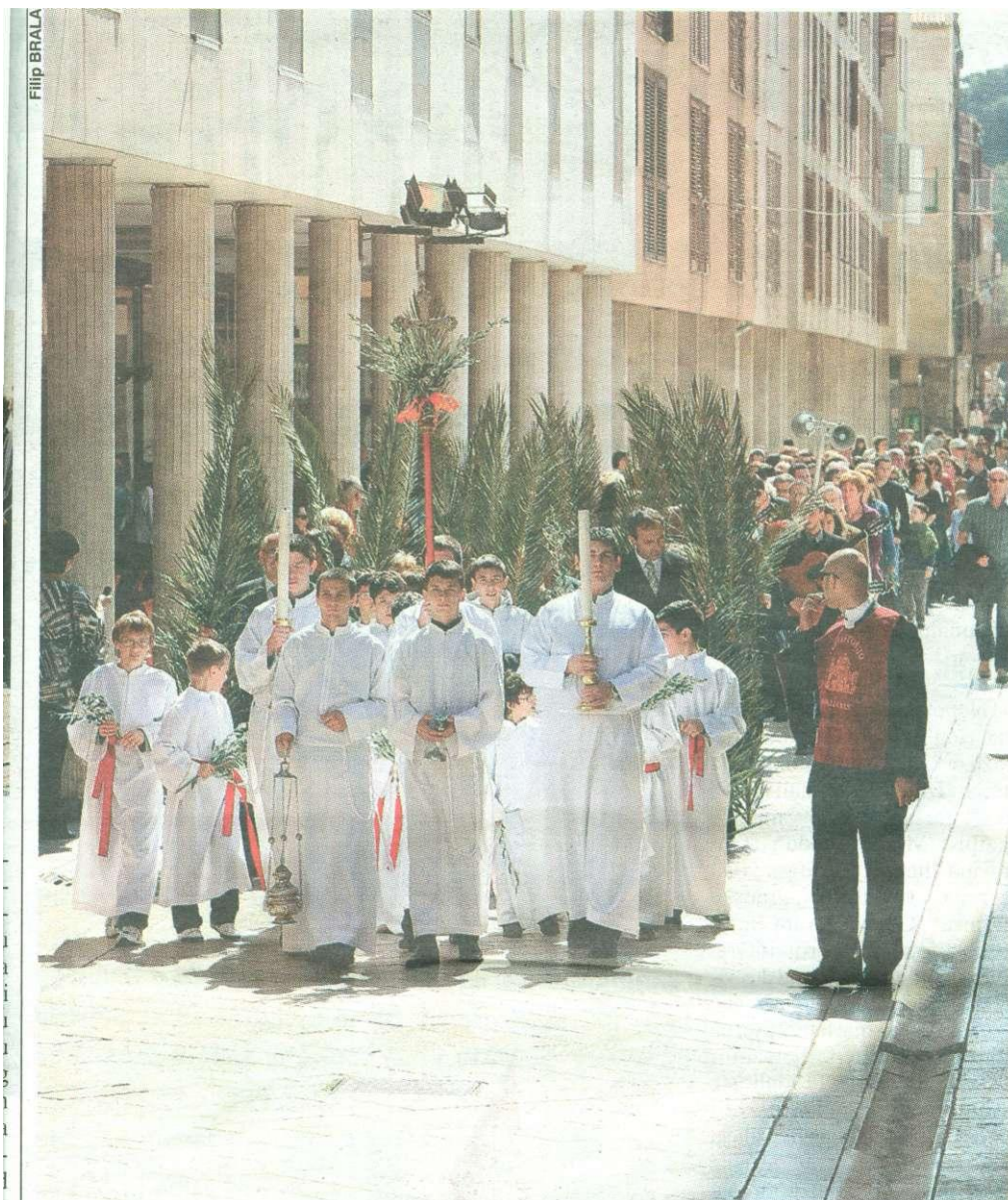
Procesija zadarskim ulicama krenula je iz crkve Sv. Marije

ZADAR - Misno slavlje na Nedjelju muke Gospodnje - Cvjetnicu u katedrali Sv. Stošije u Zadru predvodio je zadarski nadbiskup mons. Zelimir Puljić. Cvjetnica je spomen na Kristov svečani ulazak u Jeruzalem gdje je dočekan od naroda s maslinovim grančicama. Za vrijeme svete mise pjevala se Muka iz Evanđelja po Mateju. Brojni vjernici najprije su se okupili u crkvi Sv. Marije u Zadru, gdje je nadbiskup blagoslovio maslinove i palmine grančice, a puk je zatim krenuo u procesiji prema zadarskoj prvostolnici gdje se slavila sveta misa.