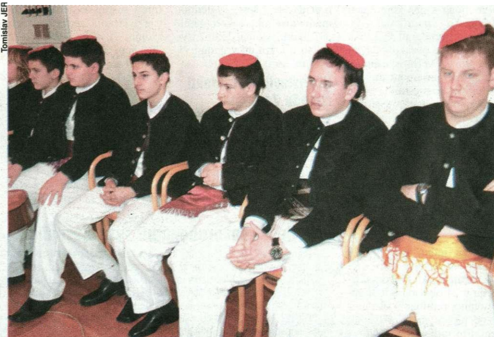
Čitavu manifestaciju nastupom su uveličali i članovi klape Pag