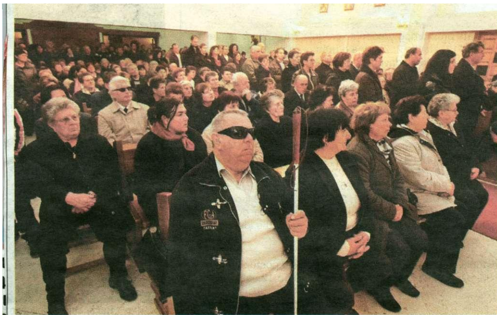
Brojni vjernici na misi u čast sv. Josipa