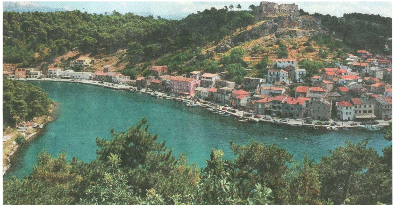
Cijela novigradska riva sada je obnovljena, a slijede završne "finese"

Što se tiče Pridrage, završeno je hortikulturno