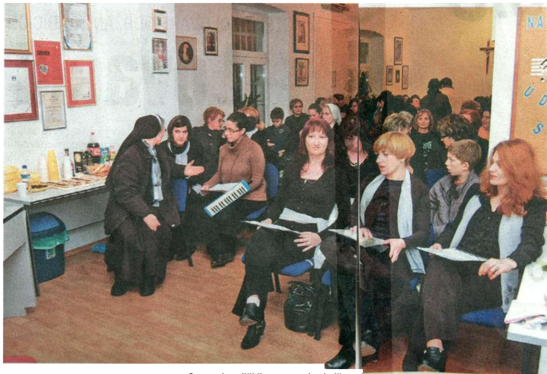
Susret katoličkih sestara i tehničara /